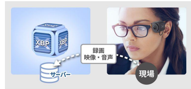
映像のサーバー保存機能 ※「サーバー保存」のオプション契約が必要