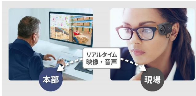
リアルタイム映像配信・閲覧機能 (ワンタッチ接続機能)