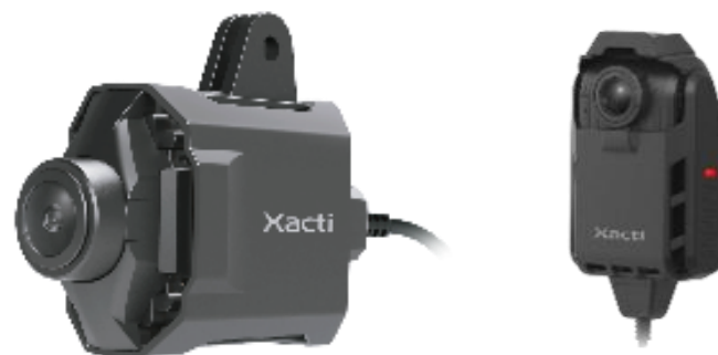
ウェアラブルカメラ