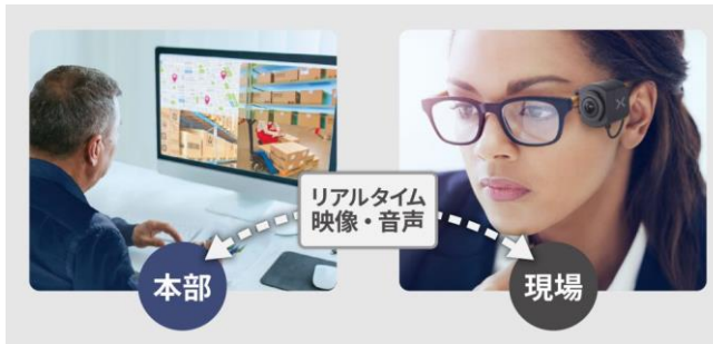
リアルタイム映像配信・閲覧機能 (ワンタッチ接続機能)