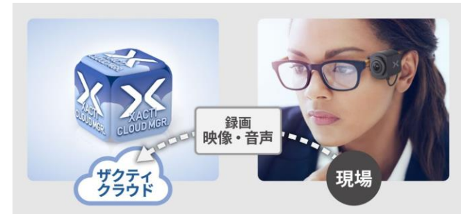
映像のクラウド保存機能 ※フル機能プランのみ