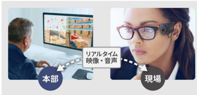
リアルタイム映像配信・閲覧機能 (ワンタッチ接続機能)