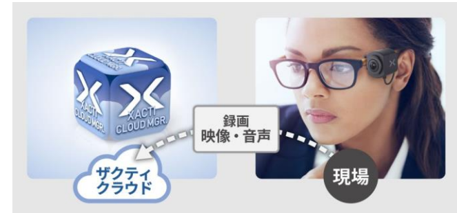
映像のクラウド保存機能 ※フル機能プランのみ